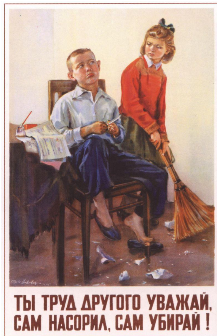
480. Низовая С. Ты труд другого уважай... 1954