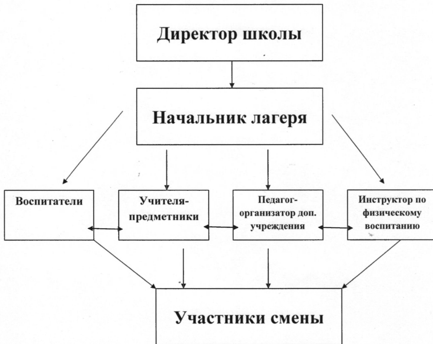
Схема управления программой « Здоровое детство- это здорово!»