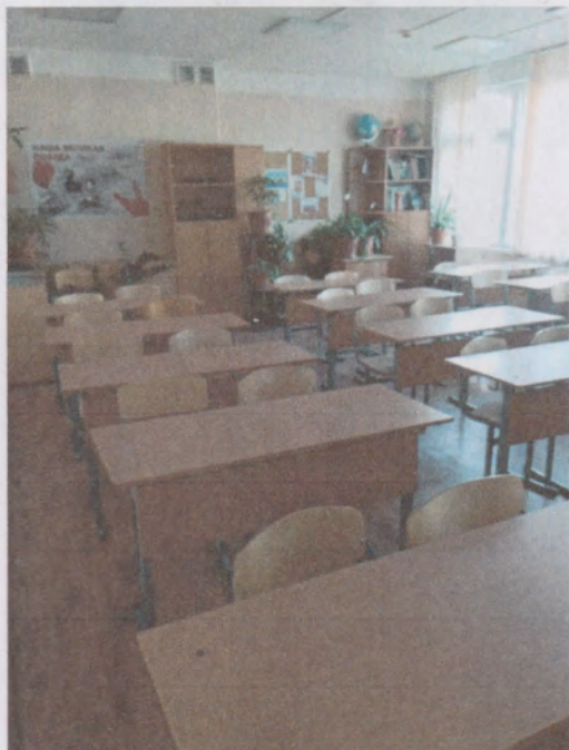
Фото 1. Кабинет №10 (вид слева)