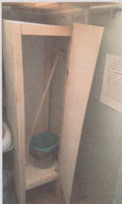
Фото 7. Шкаф для инвентаря