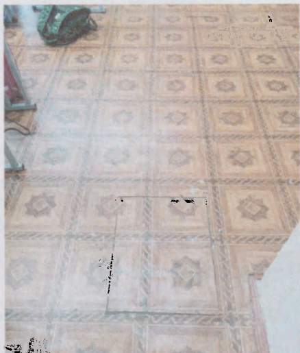
Фото 5. Кабинет №26