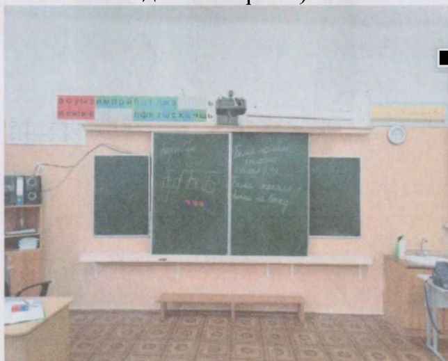
Фото 3. Кабинет №7 (интерактивная доска закрыта)