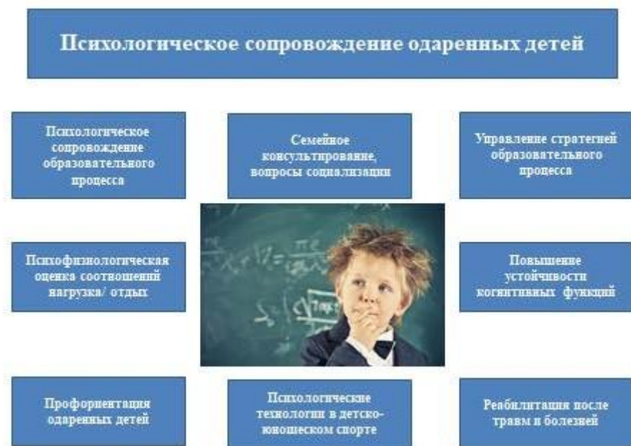
Рис. 2. Психологическое сопровождение одаренных детей

образовательных организациях (Концепция развития психологической службы в системе образования в Российской Федерации на период до 2025 года утверждена министром образования и науки РФ О. Ю. Васильевой 19 декабря 2017 г.), основные направления которого представлены на рис. 2.