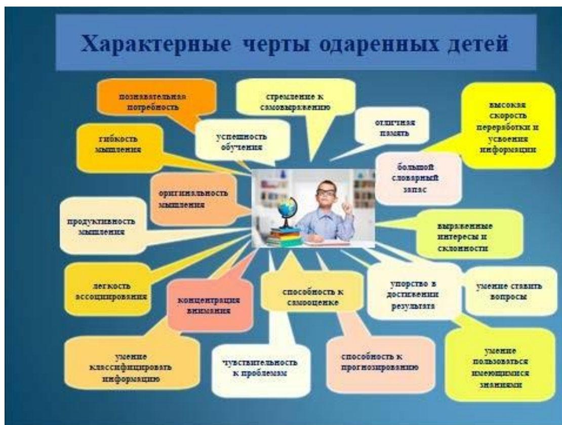
Рис. 1 Характерные черты одаренных детей.

Этот перечень можно дополнить следующими чертами: