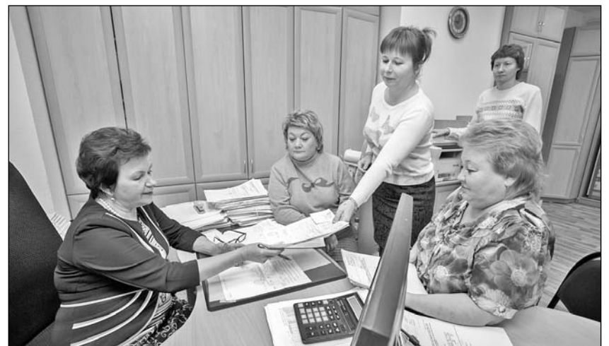
Специалисты отдела финансовой консолидированной отчетности обсуждают особенности составления годового отчета

Так что в отличие от статистики, которая, как утверждали Ильф и Петров в своем романе «Двенадцать стульев», знает все, кроме того, сколько в СССР стульев, наша бухгалтерия будет обладать абсолютной полнотой информации.