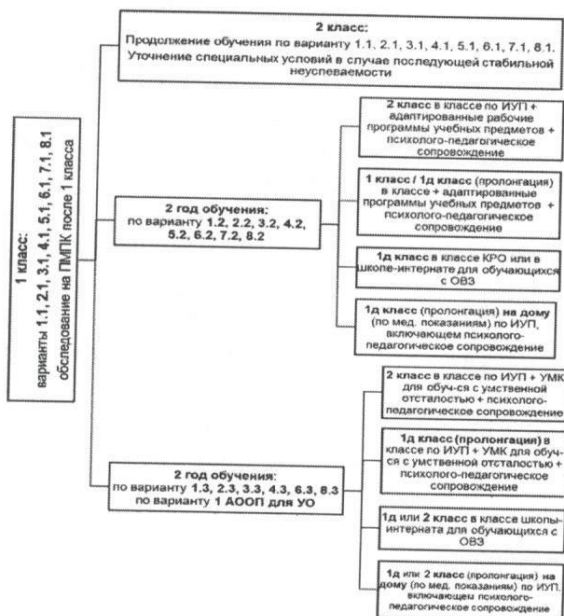
Схема 1: Организация образования обучающегося с ОВЗ при переводе с варианта 1 АООП (по нозологии)

Вариативность организации образования представлена на схеме 1.