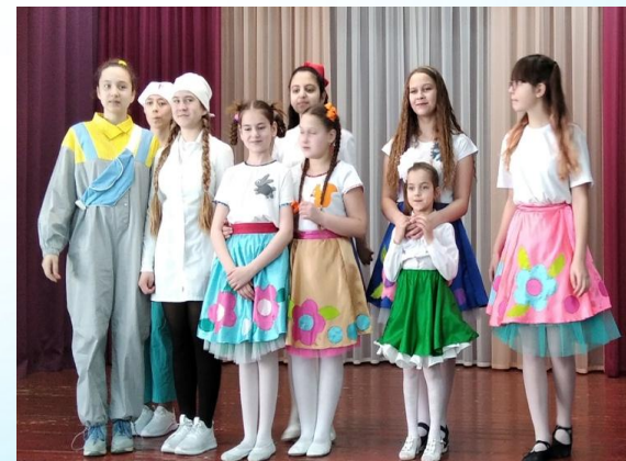
Премьера "Незнайка и его друзья" Стр. 7