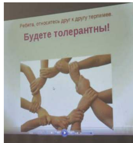
Фото с Международного Дня толерантности