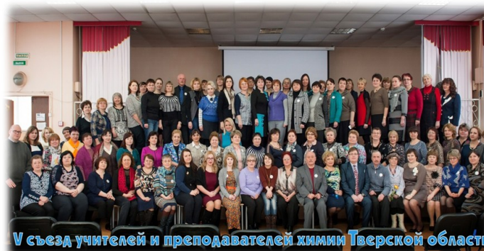
В съезде учителей и преподавателей химии Тверской области