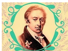
75-летие Николая Михайловича Карамзина

С 6 по 12 декабря в библиотеках муниципальной библиотечной системы Твери пройдет