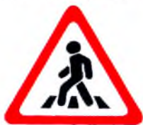
1.22. «Пешеходный переход»

Знак 1.22 (треугольный с красной каймой) относится к группе