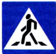
5.19.1. «Пешеходный переход»

предупреждающих знаков и предупреждает водителя, что впереди — знак 5.19.1. и пешеходный переход. А знак 5.19.1 (квадратный синий), имеющий то же название, относится к группе знаков особых предписаний и указывает пешеходам, что через дорогу необходимо переходить именно здесь.