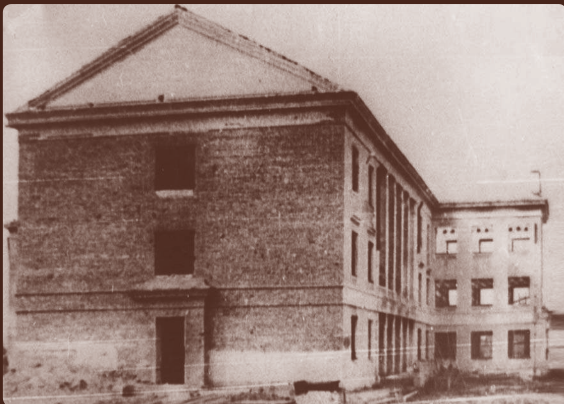
Здание школы после войны