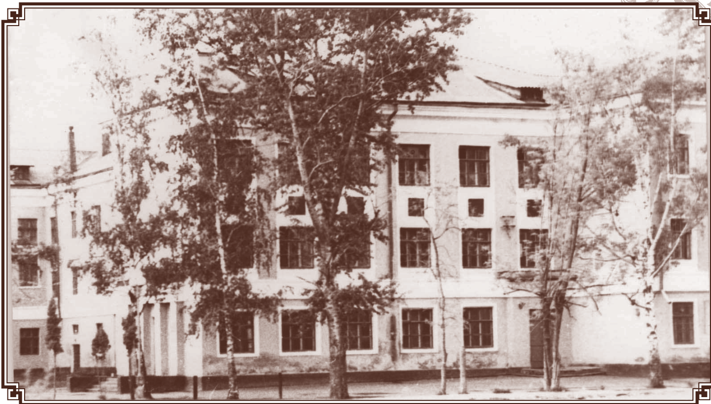
Школа, 70-90 годы