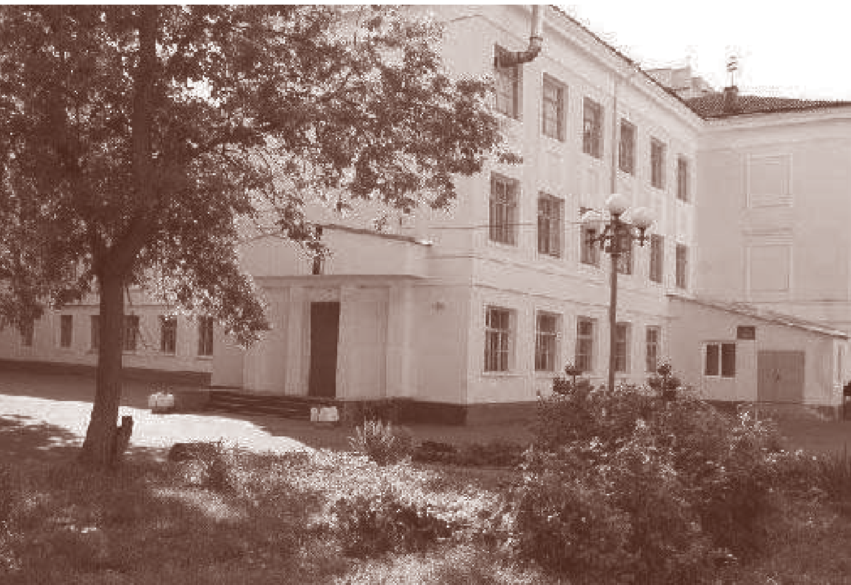
Гимназия 2010 год