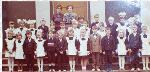
1992/93 Эти ребята были первыми, кто начал постигать основы информатики с первого класса