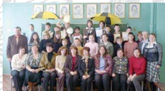
2008/09 В первом Тверском городском турнире по информатике, организованном Тверским государственным университетом для школьников 5-7 классов, участвовало от гимназии 3 команды, получено много призовых мест, грамот и подарков.