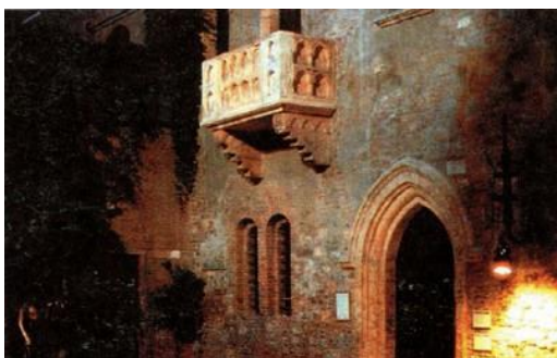
Дом Джульетты в Вероне

Вопросительной интонацией заканчивается первый раздел увертюры. И после короткой паузы... вновь звучит музыка. Патер Лоренцо продолжает свой рассказ — начинается новый раздел симфонического произведения — разработка .