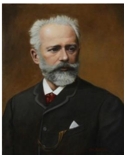
Петр Ильич Чайковский.

А вот великий русский композитор П.И.Чайковский говорил вот что о себе : «Я ещё не встречал человека, более меня влюбленного в матушку-Русь...Я страстно люблю русского человека, русскую речь, русский склад ума, русские обычаи...Я проникся неизъяснимой красотой...русской народной музыки...»