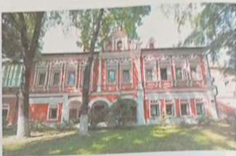
Юсуповский дворец в Москве

ставшие близкими и дорогими сердцу поэта, запечатлены во многих его произведениях. Пушкинская Москва — это и тихие улочки, бульвары, переулки, по которым любил гулять поэт, которые навевали ему воспоминания о детстве. Недаром свою любимую героиню из романа «Евгений Онегин», с которым вы познакомитесь в старших классах, Пушкин поселил в Москве «у Харитонья в переулке». В Большом Харитоньевском переулке семья Пушкиных жила, когда он был ещё ребёнком. Навсегда запомнился ему Юсуповский дворец — так называли дом князя Н. Б. Юсупова, известного государственного деятеля екатерининских времён, любителя искусств и крупнейшего коллекционера, которому посвящено одно из стихотворений Пушкина. Во флигеле этого дома снимала квартиру семья Пушкиных. С детства сохранились у поэта впечатления о прогулках в тенистом Юсуповском саду, простиравшемся до Красных ворот. Именно такая тихая, спокойная Москва, располагающая к размышлениям о душе и вечности, была особенно близка поэту.