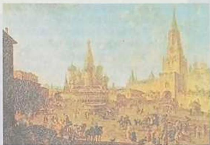
Красная площадь в Москве. Худ. Ф. Я. Алексеев. 1801

Не случайно Москва занимает значительное место в русской литературе. Кажется, нет ни одного великого русского писателя, творчество которого так или иначе не отразило бы кровную связь с Москвой. Здесь родились Пушкин и Лермонтов, Островский и Достоевский, в разное время в Москве жили Гоголь и Тургенев, Чехов и Толстой. Москва стала источником творческого вдохновения русских писателей и поэтов на протяжении веков вплоть до наших дней. Вглядываясь в неповторимые черты этого древнего и вечно молодого города, они стремились понять движение истории, разгадать загадку русского национального характера, постичь тайну русской души.