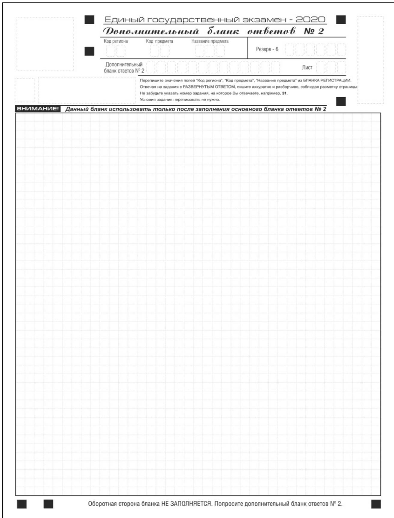
Рис. 15. Дополнительный бланк ответов № 2