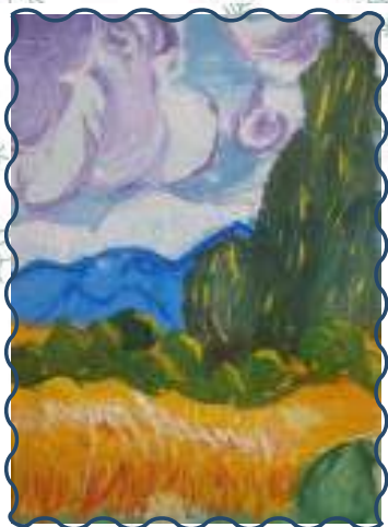
Журавлёва Мила, ученица 2Б класса