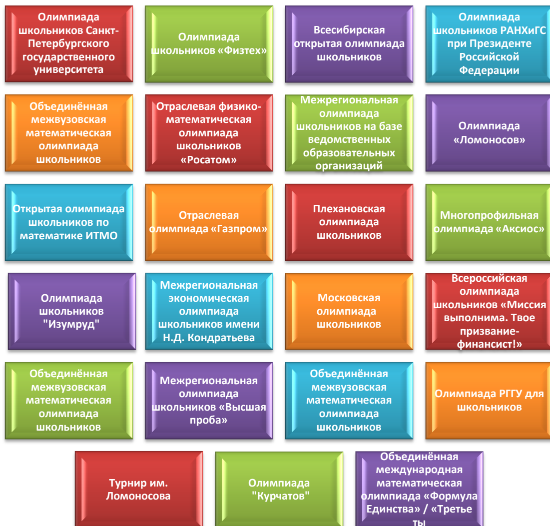
Рис.5 Олимпиады Российского Совета олимпиад школьников, в которых регулярно побеждают учащиеся МБОУ СОШ № 17