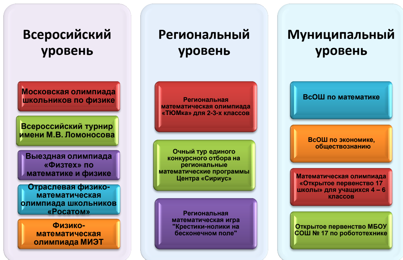
Рис.2 Олимпиады, проводимые на базе школы