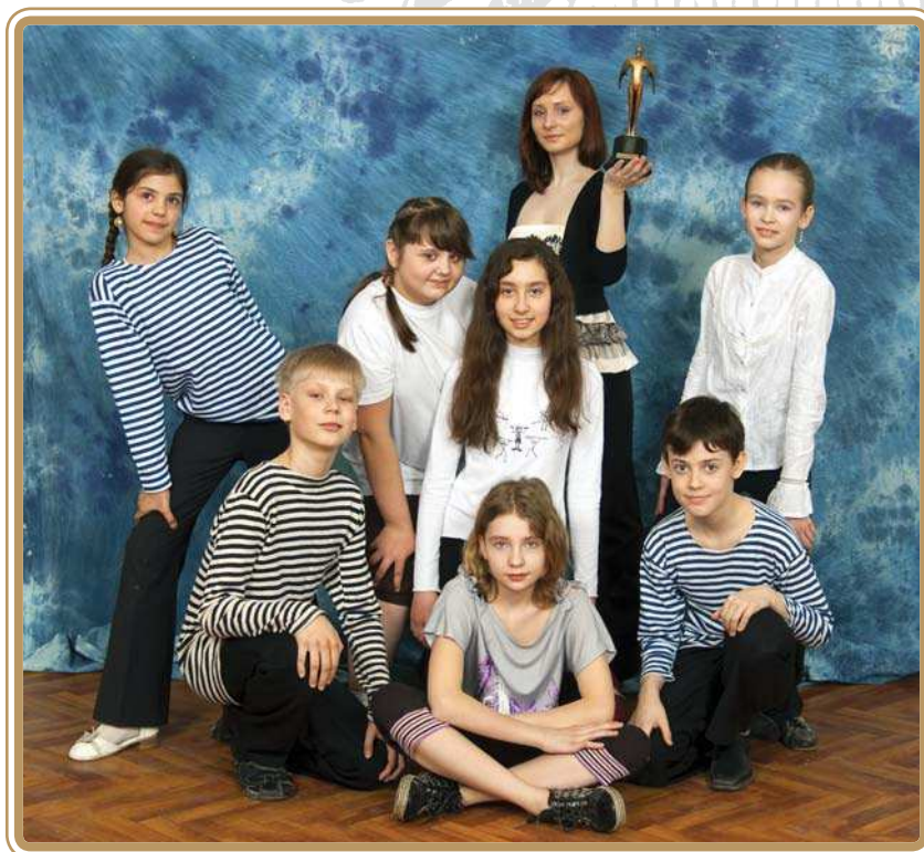
Танцевальный коллектив дипломат «Танцевального марафона-2009»